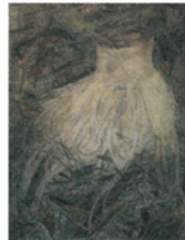
千坂尚義 「竹の切り株」 2017(平成29)年 (第3回石本正 日本画大賞展 ・大賞作品)