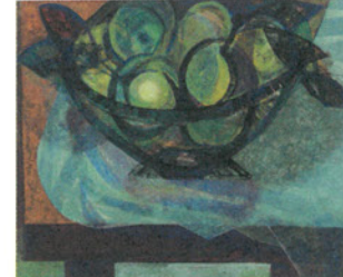
「静物(卓上の果物)」1953(昭和28)年頃