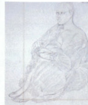
「裸婦」 1992 (平成4)年

2019.1.2[水]～3.17[日] 石本正・心の眼2 ～私を感動させた日本画～