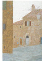
中村文子 「昼下り」 2017(平成29)年 (第7回石州和紙に 描いた日本画展 出品作品)