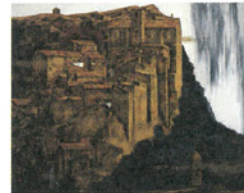
松倉茂比古「往者」1994(平成6)年

2019.1.2[水]～3.17[日] 石本正・心の眼2 ～私を感動させた日本画～