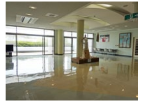
▲展示会場の「アクアみすみ」ロビー