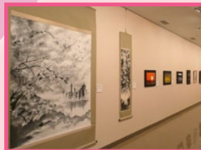
(昨年の展示の様子)