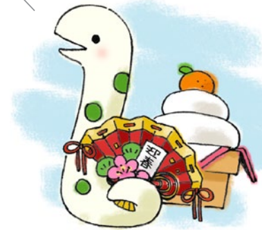
【みーちゃん】 石正美術館マスコット 「くーちゃん」のおともだち