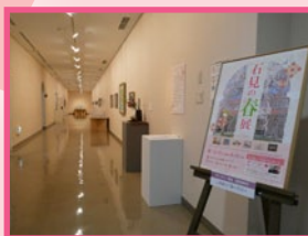
(昨年の展示の様子)